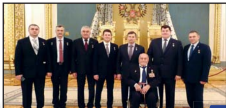
День Героев Отечества