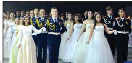
Международный кадетский бал