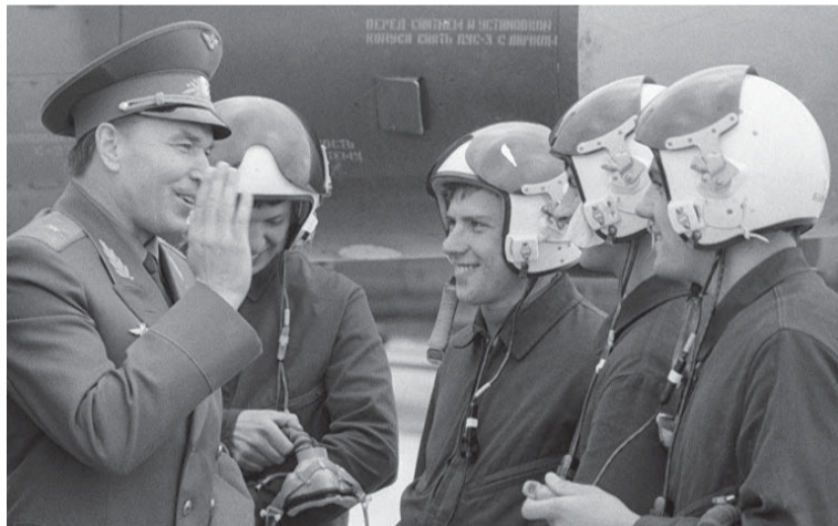
Члены РАГ и Клуба Героев

звание Героя Советского Союза. Это только некоторые штрихи из его насыщенной событиями армейской биографии. За период службы в ВВС Николай Тимофеевич поднимал в небо 42 типа отечественных и зарубежных самолетов и вертолетов. За высочайшее лётное мастерство, ему присвоено звание «Заслуженный военный летчик Российской Федерации». После увольнения с военной службы он на общественной работе. С 2002 года Николай Тимофеевич бессменный руководитель «Клуба Героев Советского Союза, Героев Российской Федерации и полных кавалеров ордена Славы города Москвы и Московской области». В 2016 году Н.Т. Антошкин избран депутатом Государственной думы Российской Федерации VII созыва по федеральному списку от партии «Единая Россия». Имя Героя Советского Союза Н.Т. Антошкина носит школа в селе Кузьминовка, школа и улица в городе Кумертау, он почётный гражданин города Кумертау и Республики Мордовия. Мы поздравляем Николая Тимофеевича с днем рождения и желаем ему здоровья и дальнейшей работы на благо народа Российской Федерации.