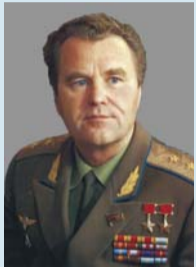
90 лет (8.12) дважды Герой Советского Союза Шаталов Владимир Александрович